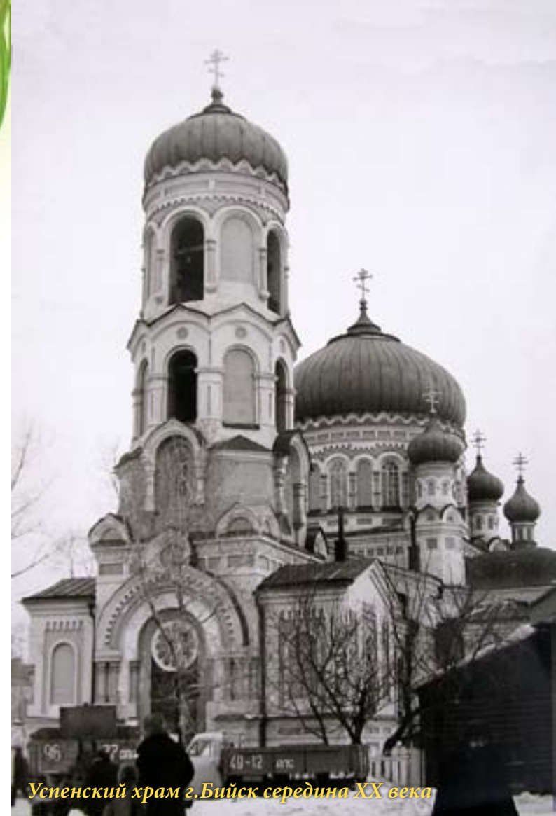
Успенский храм г.Бийск середина XX века

В 30-е годы XX века было самое сильное гонение на Церковь за все годы советской власти: небывалое административное и идеологическое давление, переходящее в психологический террор, налоговый пресс, обнищание приходов, репрессии в отношении священнослужителей и верующих. Церкви разрушали, священнослужителей, псаломщиков и верующих мирян расстреливали или ссылали в лагеря. Было арестовано и впоследствии расстреляно подавляющее большинство представителей епископата и клира. К 1939 году из всех архиереев в стране осталось лишь 4 правящих епископа. «С 1937 года по 1942-й на территории Сибири не было ни одного правящего архиерея», поэтому все сибирские епархии прекратили свое бытие. По общему количеству репрессированных (60 тыс. человек) Алтай входит в первую тройку среди регионов России. В эти кровавые годы Алтайская земля обрела новый сонм мучеников и исповедников. По данным Уполномоченного по делам РПЦ при СНК СССР по Новосибирской области, за 1931 - 1937 гг. на Алтае было закрыто 185 православных церквей. За