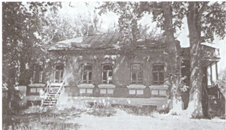
Дом игуменьи Бийского Тихвинского монастыря. С. Боровое. Совр. фото

ском монастыре насельницы исполняли разнообразнейшую работу. Больше всех было поющих на клиросе (клирошанок) и рукодельниц. Занимались также хлебопечением (пекли хлеб для своих нужд и на продажу), огородничеством, уходом за рогатым скотом и домашней птицей, садоводством, портняжным делом, вышиванием, стежили одеяла, шили обувь для сестер монастыря (в чеботарне). Была умелица, шившая шубы для сестер. Обучались письмоводству, изготавливали свечи. Работали на кухне и в трапезной, готовили квас для сестер. Особое послушание – чтение неугасимой Псалтири в церкви, которое в основном несли пожилые монахини. Были монахини, читавшие псалтирь над усопшими в г. Бийске. При монастыре была устроена мастерская по изготовлению восковых свечей.