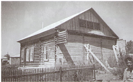
Остатки келейного корпуса Бийского Тихвинского монастыря. С. Боровое

На монастырь шли деньги в основном за отпевание усопших, сорокоусты, вечные поминовения либо плата за вышитые изделия монастырских рукодельниц. Не забывал монастырь и владыка Макарий, митрополит Московский. В 1915 г. из Москвы он прислал 60 руб. на неугасимую лампаду на могилу схимонахини Анны (Тороповой).